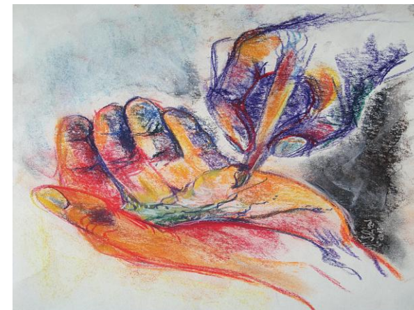
Gabi Scherzer, Ich habe dich eingezeichnet in meine Hand (2013), Pastellkrei- dezeichnung, 28 x 36 cm; © Gabi Scherzer

„Gott kennt meinen Namen- ich darf Gott beim Namen nennen“